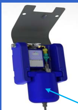
Aardvark (etukansi auki)

2 nestettä sekoitetaan 24 tunnin jakson aikana ja ne tuottavat aktiivisen biologisen liuoksen, joka annostellaan viemäriin tai jätevesijärjestelmään kerran päivässä.